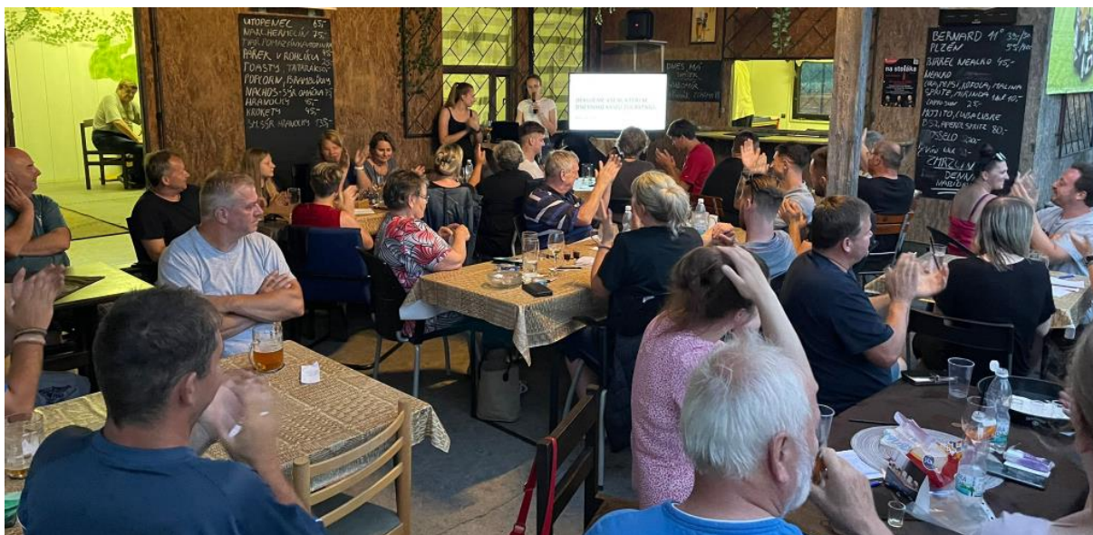
Sbor pro občanské záležitosti